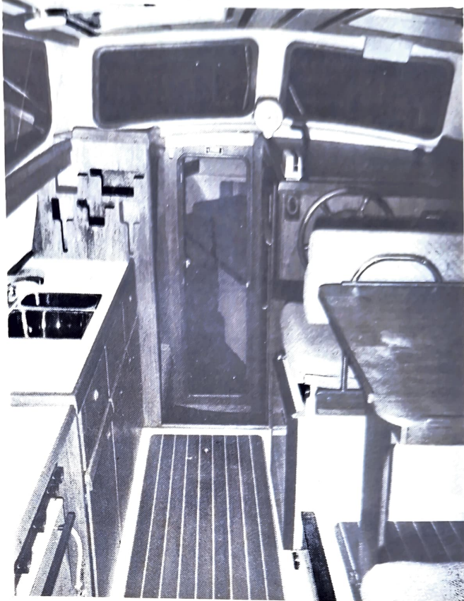
Une timonerie qui fait en même temps cuisine et salon de port